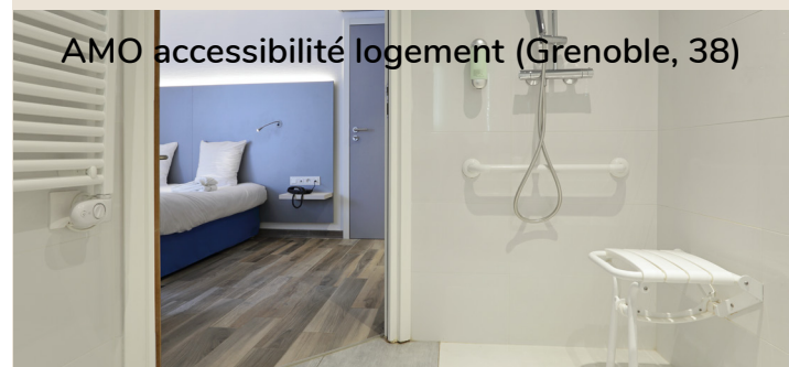
AMO accessibilité logement (Grenoble, 38)