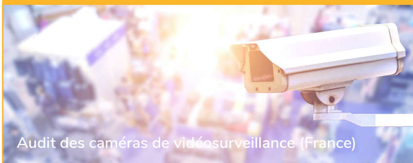
Audit des caméras de vidéosurveillance (France)