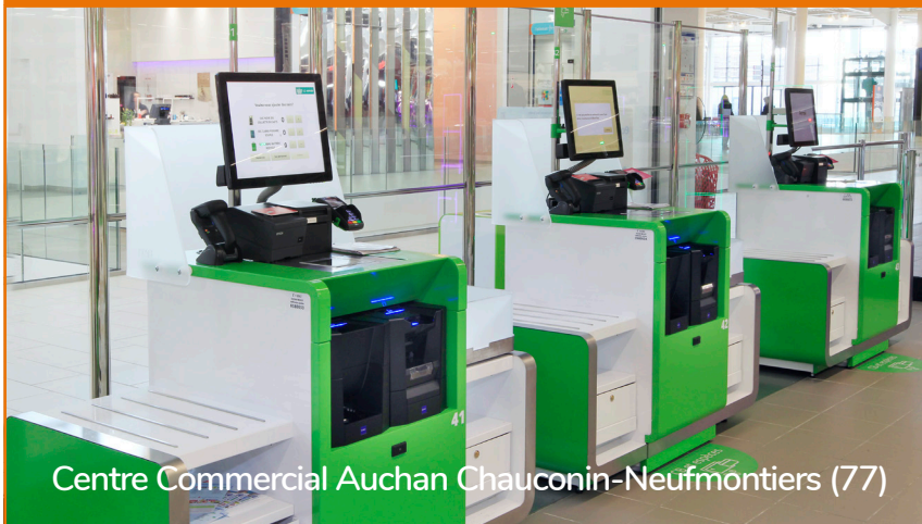
Centre Commercial Auchan Chauconin-Neufmontiers (77)